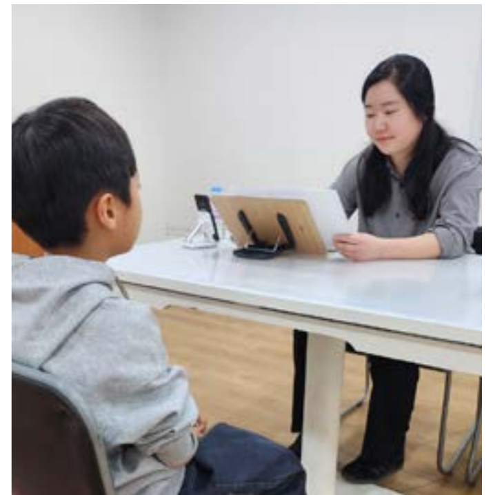
읽기 유창성과 독해력 검사 모습

장치를 기반으로 아이들이 책을 읽을 때 어디를 어떻게 보는지 함께 분석하고 있다. 컴퓨터로 그림책을 보여주면서 모니터 하단에 장착된 시선추적기를 통해 아이들이 책을 읽는 과정에서 나타나는 시선을 그대로 기록하는 것이다. 이를 통해 아이가 소리 내어 읽지 않아도 어떤 속도로 책을 읽는지, 글과 그림을 잘 통합하며 읽는지, 주요 문장을 집중해서 읽는지, 어떤 부분을 읽기 어려워하는지 등을 파악할 수 있다. 즉, 기존에 검사 결과만으로는 알 수 없던 아동의 읽기과정을 심층적으로 분석함으로써 아동마다 개별적으로 나타내는 읽기의 특성을 반영하여 맞춤형 교육을 실시할 수 있는 밑바탕이 될 것으로 기대된다. 검사 결과를 바탕으로 맞춤형 문해 교육 시작 3월 이루어진 문해 검사 결과를 바탕으로 4월 5일부터 6주간 「글놀이터 초등과정」 파일럿 프로그램이 아동 개별 수준에 맞춰 시작된다. 파일럿