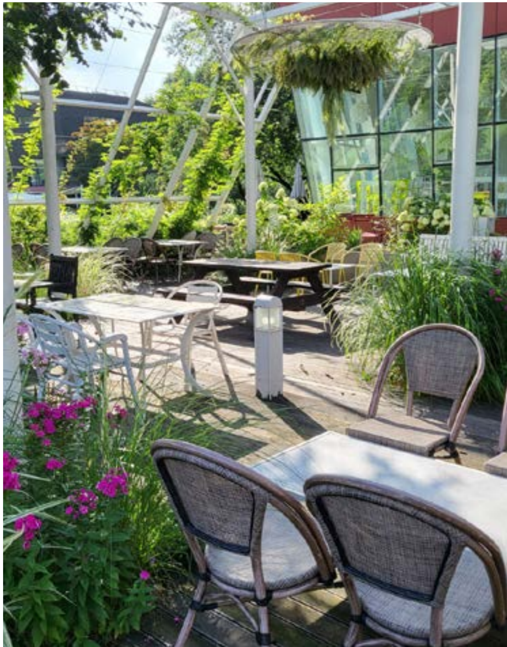
1. Plantation Bakery Cafe