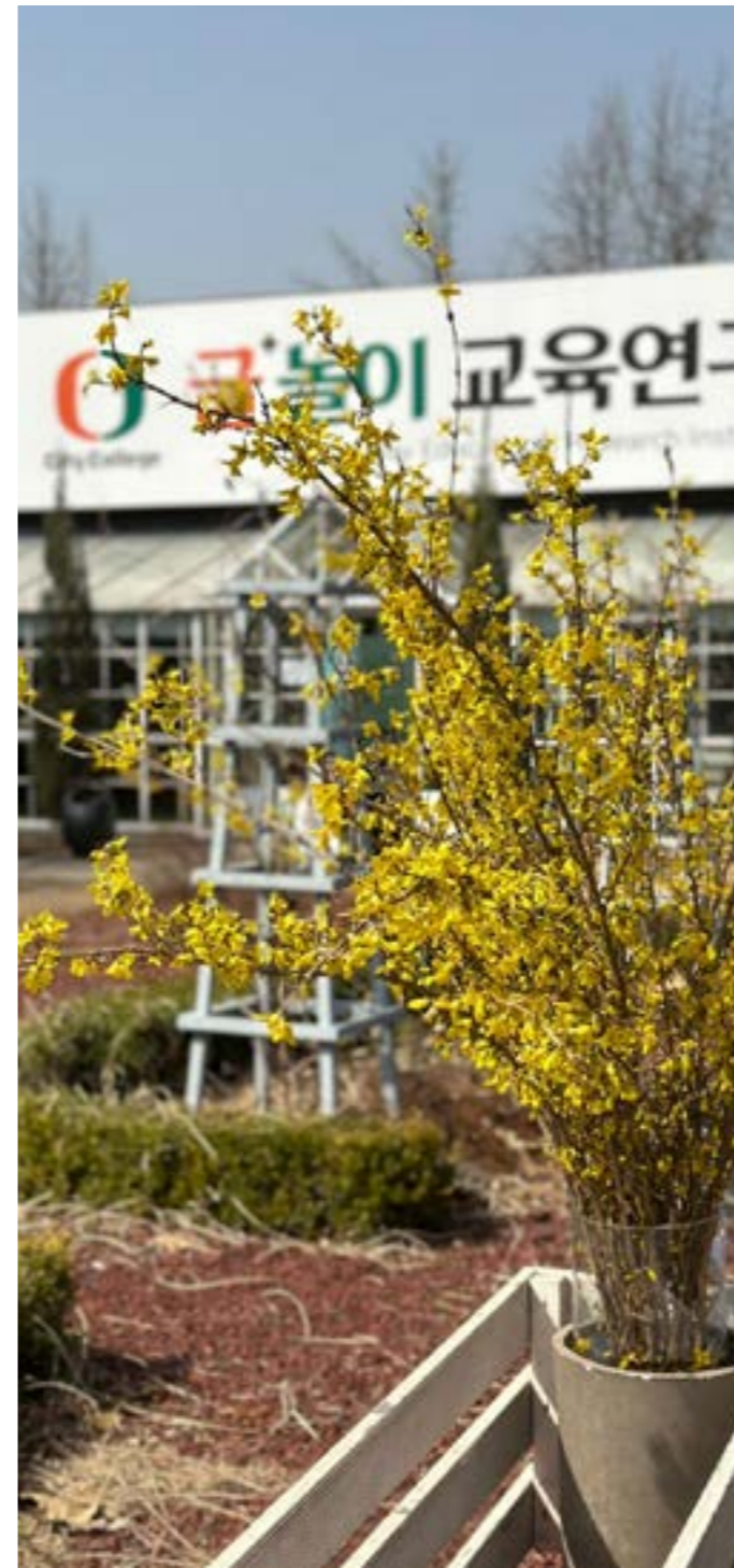
글+놀이 교육연구소의 봄

해 수준을 파악해볼 수 있도록 문해 검사를 실시하고 결과지를 무료로 제공받게 된다. 파일럿 프로그램 실시 전 아동의 문해 수준을 미리 점검하고, 프로그램에 참여하여 문해 교육을 받은 이후 문해 수준이 얼마나 증진되었는지 알아보기 위함이다. 문해 검사에는 읽기 유창성과 독해력을 검사하는 과정이 포함되어 있다. 읽기 유창성 검사에서는 아동이 주어진 시간 내에 얼마나 많은 글자를 정확하게 읽는가를 측정하며, 독해력 검사에서는 문맥에 맞는 적절한 단어를 얼마나 잘 선택할 수 있는가를 측정한다. 해당 검사는 또래 아동에 비해 상대적인 수준을 알 수 있고, 어떤 부분이 부진한지 확인해 볼 수 있다는 장점이 있으며, 아동의 수준에 따라 교수·학습 계획을 수립하는데 유용한 정보를 제공한다. 아동의 시선을 추적하여 읽기과정에 대한 전문적 분석 글+놀이 교육연구소는 학술 연구를 위한 시선 추적