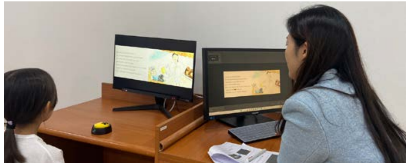
시선추적기를 활용한 이야기이해력 검사 모습과 아동의 그림책 읽기 시 시선 기록 화면

「글놀이터 초등과정」 파일럿 프로그램 모집 소식 최근 씨티칼리지 글+놀이 교육연구소는 따뜻한 봄을 맞이하여 새로운 소식으로 분주하다. 지난 3월 홈페이지( https://www.citycollege.ac )와 인스타그램(계정: literacy_play)을 통해 아동 문해 프로그램인 「글놀이터 초등과정」에 참여할 초등학생들을 모집한 것이다. 이번에 열린 프로그램은 연구소에서 새롭게 개발한 문해 교육과정을 초등학교 2학년 아동 대상으로 시범 운영함으로써 프로그램의 효과성을 검증하기 위한 것이다. 파일럿 프로그램이 시작된다는 소식에 많은 초등학생 부모들이 관심을 보였고, 참여 아동 모집은 성황리에 마감되었다. 읽기 유창성과 이해력 등 문해 검사 실시 후 결과지 제공 「글놀이터 초등과정」 파일럿 프로그램에 참여를 신청한 아동은 추첨을 통해 온오프 문해 수업 12회뿐만 아니라, 객관적으로 아동의 문