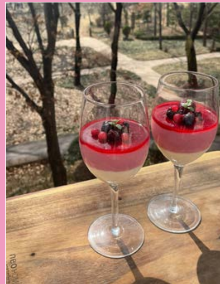
5. Raspberry Cream Mousse