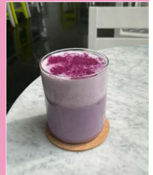
4. Purple Sweet Potato Latte