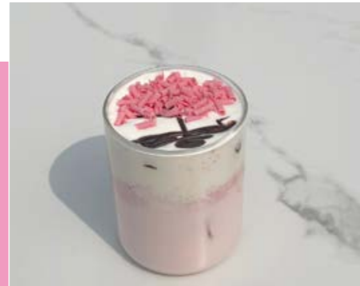
3. Cherry Blossom Latte