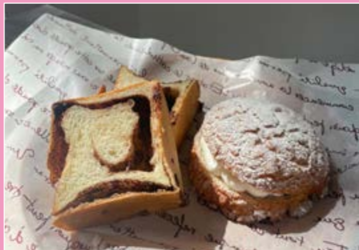
2. Mini Chocolate Bread, Fresh Cream Soboro